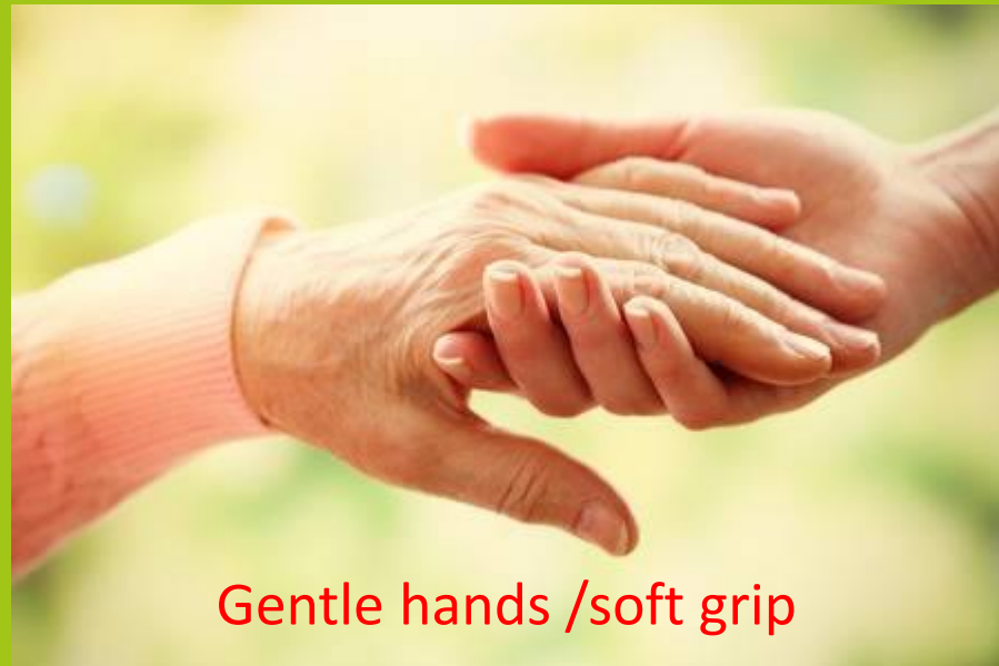
Gentle hands /soft grip